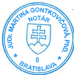
Dana Gálíková zamestnanec poverený notárom