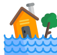
Poistenie proti živelným pohromám