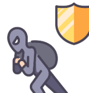
Poistenie proti krádeži